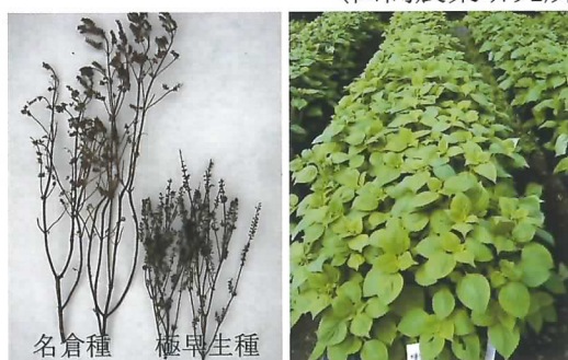
草丈は名倉種の半分