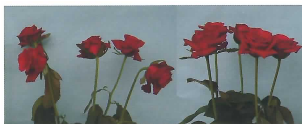
蕾が閉じた状態で収穫 少し開いた状態で収穫

バラの切花は、暑い時期には咲ききらずにしておいてしまうことがよくあります。この原因として、収穫時期と収穫後の取り扱いが関係していることがわかり、対策が明らかになりました。①高温時には、蕾が少し開いた状態で収穫する、②収穫後は清潔な水で水揚げを行う、③輸送時はできるだけ低温に保つ、ことで防ぐことができます。(園芸研究部)