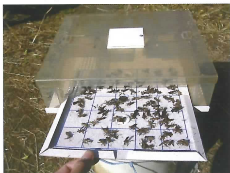
改良型トラップに捕殺されたホソヘリカメムシ

ダイズの莢や子実を加害し、品質を低下させる害虫ホソヘリカメムシの発生数の推移を把握するのに、乾式粘着トラップと集合フェロモンを用いた改良型トラップが有効であることが分かりました。このトラップを用い、現地で防除の適否や適期を判断する方法を検証しています。(環境基盤研究部)