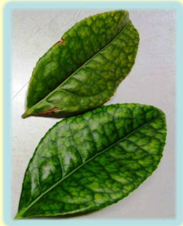
茶葉の亜鉛欠乏症状

食品添加物であるグルコン酸亜鉛は、茶の亜鉛欠乏対策として、安全で有効な葉面散布剤であることを明らかにしました。