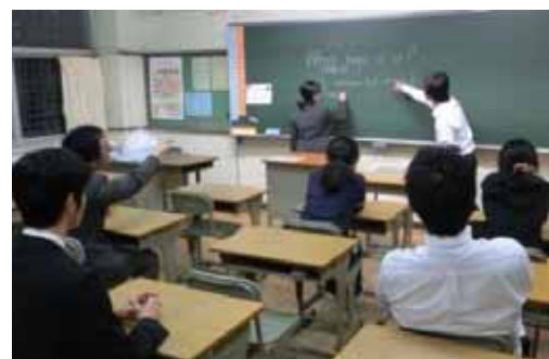
【若手教員による英語の模擬授業の様子】