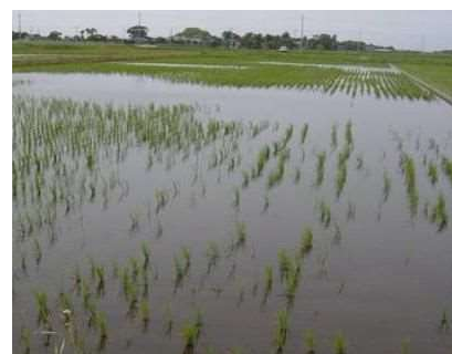
食害を受けた水田