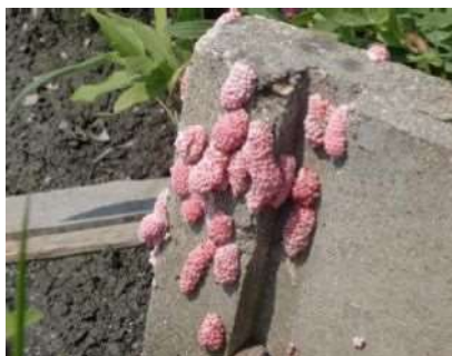
用水路（水口）の卵塊