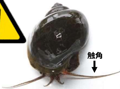
ジャンボタニシ (スクミリンゴガイ)