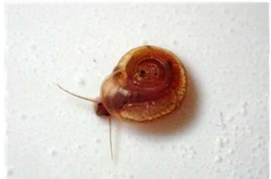
ヒラマキガイモドキ（約4mm）

四谷の千枚田に生きる両生類・貝類などを観察します。ヒラマキガイモドキ（約4mm）といった微小貝も探してみよう！