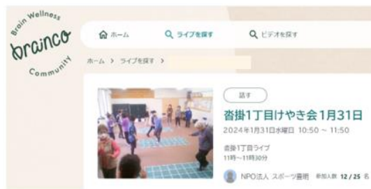
オンラインコミュニティの一例