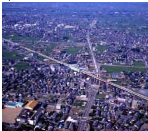
鉄道高架による踏切除去