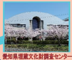
愛知県埋蔵文化財調査センター

HP https://www.pref.aichi.jp/soshiki/maizobunkazai/ Mail maizobunkazai@pref.aichi.lg.jp