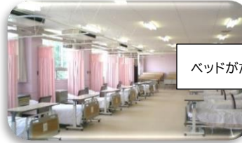
ベッドがたくさん 看護実習室