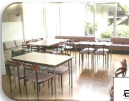
昼食・休憩はこちらで 学生ホール