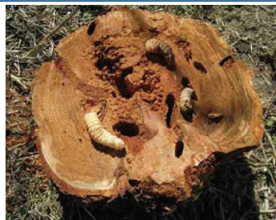
クビアカツヤカミキリの幼虫