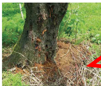
クビアカツヤカミキリのフラス