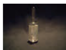
戦後にできた特効薬 「プロミン」