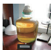
効果が不確かだ った「大風子油」