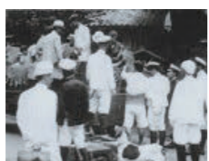
昭和13年 熊本の本妙寺周辺集落の 「強制収容」時の写真