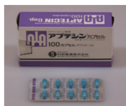
殺菌作用のある 内服薬