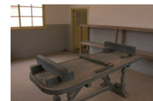
断種のための手術台

←園内通用券 療養所では、入所者の逃亡を防止するため、お金の代わりにその療養所でしか通用しない券を発行していました。