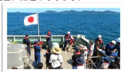
昨年度見学ツアーの様子