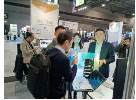
中国スタートアップによるブース出展の様子（3月14日）