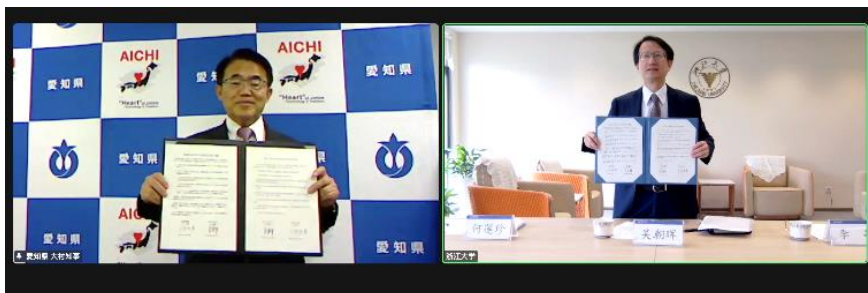
浙江大学とのMOU締結式の様子（2022年6月30日）