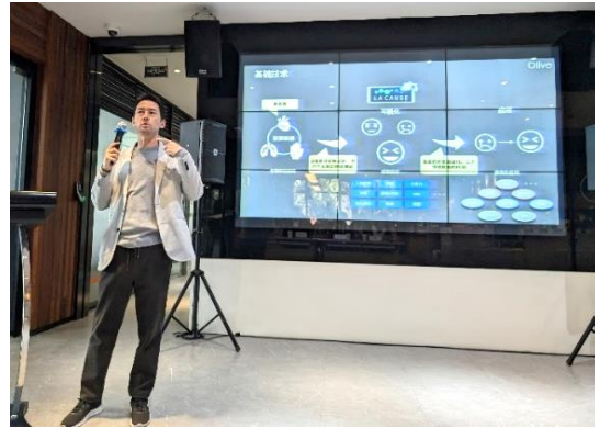
上海交通大学との連携プログラム ピッチの様子（2023年12月21日）