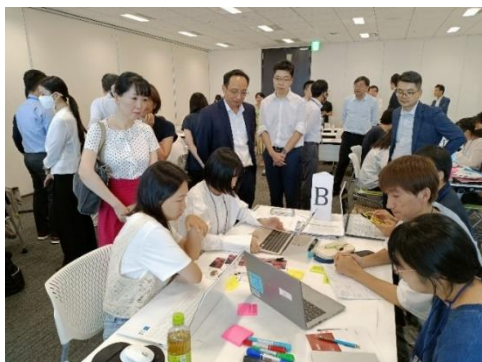
アイデアソンの様子 （2023年8月22日）