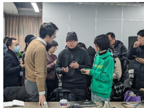
北京でのピッチイベント後の交流 (2023年12月18日)