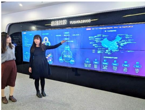
Tus 本社を訪問し、概要説明を受ける (2023年12月18日)