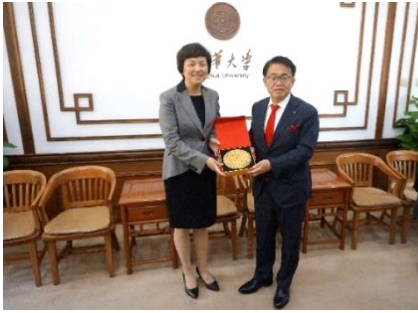
清華大学訪問の様子 (2019年5月13日)