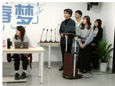
県内学生によるピッチの様子 （2023年12月14日）