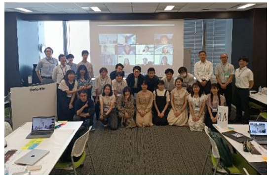
学生交流・創業支援プログラム （2023年8月23日）