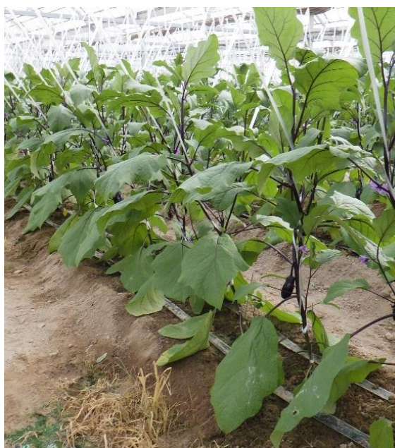
写真1 定植初期の「試交 17-22」

「試交 17-22」の特徴としては、〔とげなし単為結果性〕であり、管理作業でとげが刺さることがなく、かつホルモン処理などの着果作業が不要なため、省力的である。果実は長卵形で、果実の揃いや光沢が良く、収穫期間を通じて安定して品質が良いため秀品率が高い。また、側枝数が「千両」と同様に多いため、側枝数が少ない「とげなし輝楽」と比較して収量性が高