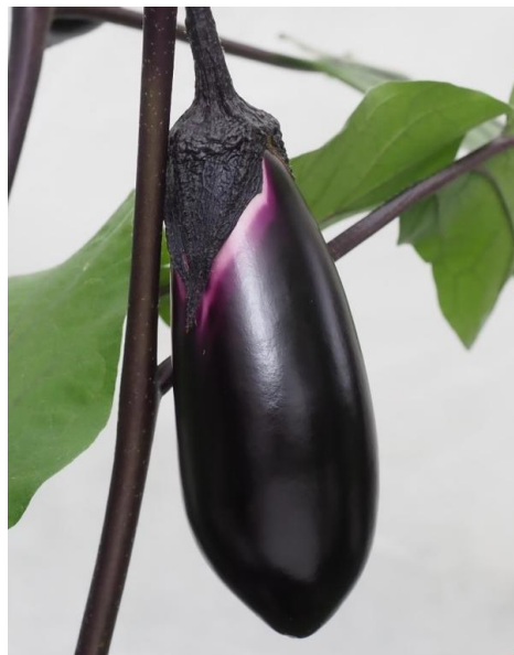
写真2 「試交 17-22」果実