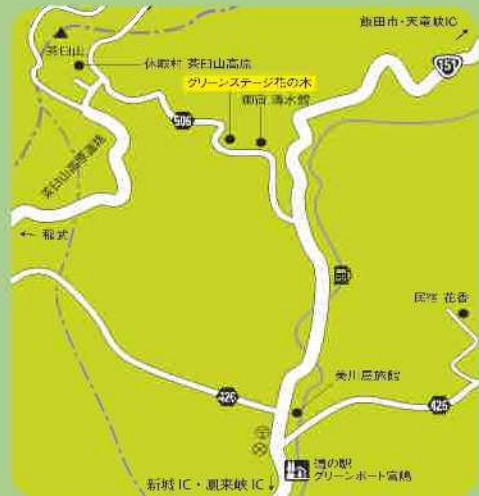
グリーンステージ花の木周辺MAP