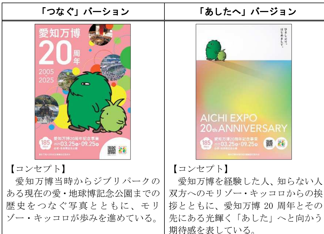
表1 キービジュアル

これらのキービジュアルは、ポスターとして県関係機関や県内市町村等の施設で掲出するとともに、ポストカードとして愛知県が実施したイベントにて配布した。