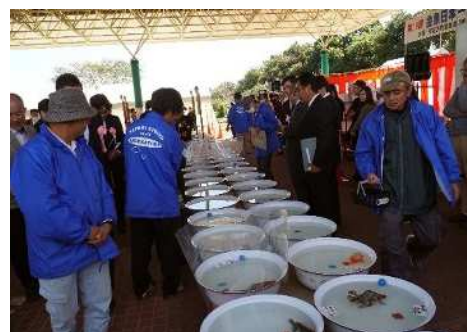
【金魚日本一大会】(弥富市)

当日は、盛況に開催され、来場者には普段見ることの少ない立派な金魚を間近に親しんでもらいました。