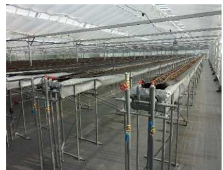
【高設栽培施設 (いちご)】 (愛西市)

今後もあいち型産地パワーアップ事業等の補助事業の活用を促進し、産地の生産力の強化等を図ります。