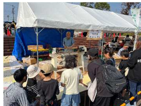
【ミニバットの製作実演】(弥富市)

本県産の木を使用したコースターづくりやミニバットの製作実演等を実施し、延べ285人の子どもたちが参加しました。