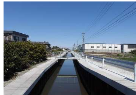
【排水路の改修】(弥富市)

津島市、愛西市、弥富市及びあま市で地盤沈下等により排水機能が低下した排水路や老朽化した護岸等の改修を7地区で行いました。