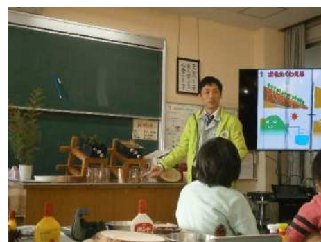
【森林の学習】（津島市）

模型を使った水源涵養機能の実験や間伐材を使用した工作を実施し、津島市立東小学校始め5校で延べ243人の児童が参加しました。