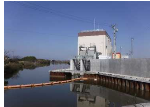
【排水機場の整備】（蟹江町）

9か所の排水機場（津島市、愛西市、弥富市、あま市、大治町、蟹江町）において、小学生を対象にした排水機場学習会を11回開催しました。