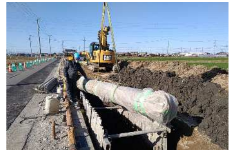
【石綿セメント管の撤去】(弥富市)

津島市、愛西市、弥富市、あま市、蟹江町及び飛島村の12地区で、老朽化した石綿セメント管や塩化ビニル管の更新を行いました。