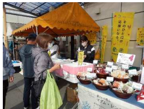
【いいともあいち即売会】（津島市）

今後も海部地域いいともあいち即売会の開催等により「いいともあいち運動」を推進します。