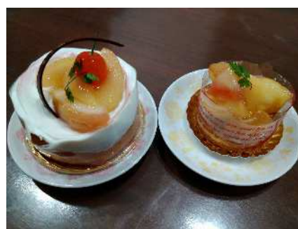
【推進店の洋菓子】（あま市）

また、いいともあいちフェイスブックにおいて、新規ネットワーク会員及び推進店、地産地消の商品やイベント等の情報を 39 回発信しました。