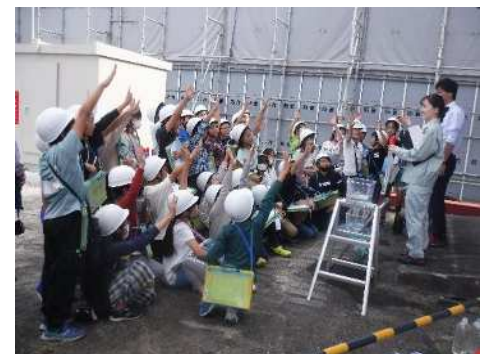
【排水機場での現地学習会】（大治町）