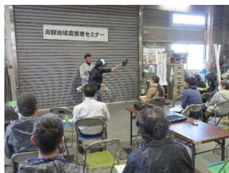
【新規就農者セミナー】（弥富市）

更に、新規学卒・Uターン等親元就農者も含めた新規就農者の定着支援として、早期の経営安定に向けた技術・知識の習得支援を行ってきました。