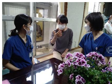
▲地域コミュニティ 保健予防活動