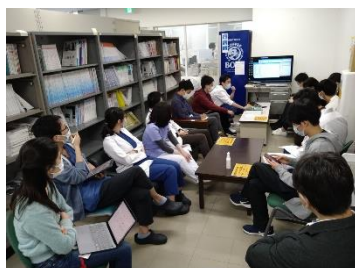
▲朝会 ER カンファレンス

毎朝 8:20 朝会 ER カンファ (8:00 外来カンファ (木曜日)) 午前 病棟管理・外来 (週 2 単位)・救急当番等 午後 病棟管理・救急当番等 夕方 ふりかえり