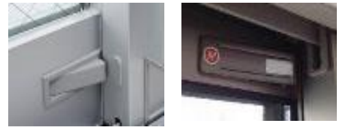
住宅等の防犯部品