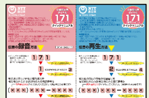
災害用伝言ダイヤル(171) クイックマニュアル

大勢が一斉に電話しようとする、回線が混み合っつながりにくくなることがありますので、安否確認には災害用伝言ダイヤルや災害用伝言板サービスを活用しましょう。