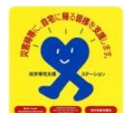
徒歩帰宅支援ステーションステッカー