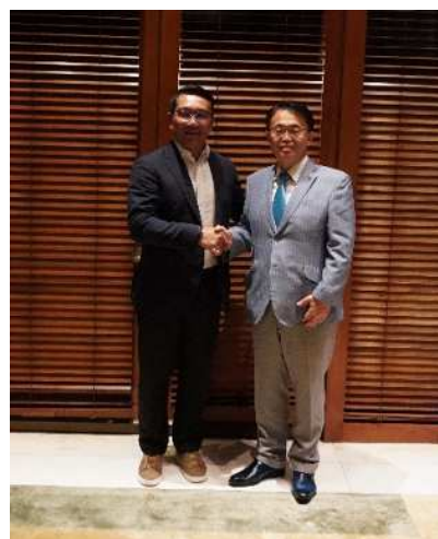
リドワン前西ジャワ州知事との記念撮影①