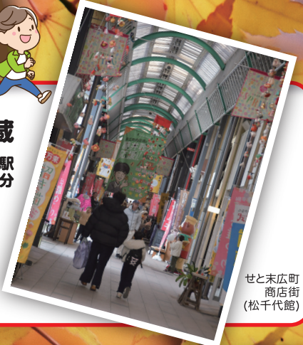
せと末広町 商店街 (松千代館)