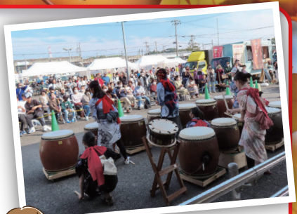
保見ふれあい祭り(昨年度)