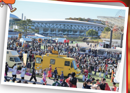
どまつりinモリコロパーク(昨年度)

「あいちウィーク」期間中(11/21~27)に、愛・地球博の会場となった「愛・パーク」や「愛・地球博記念公園」を巡ります。また、踊りの祭典「どまつりinモリコロパーク」が開催されており、特設ステージでチーム演舞を楽しむことができます。