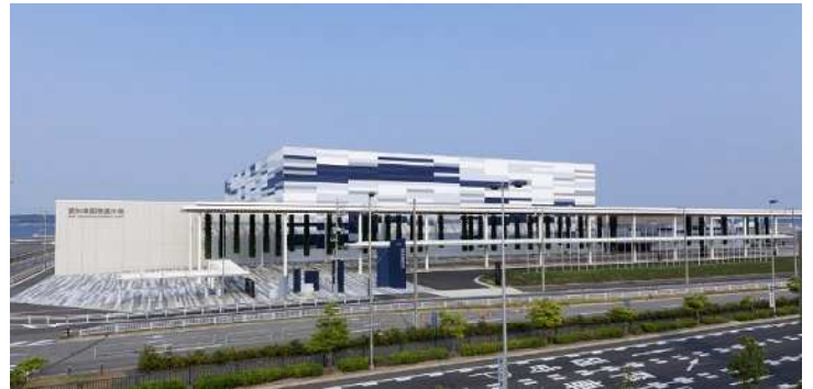
Aichi Sky Expo

愛知県は、製造業を中心とした世界有数の産業集積があり、国際空港や高規格道路網等の充実した交通インフラを有しています。Aichi Sky Expo（以下、ASE）は、こうした愛知県の特性を活かし、展示会等を通じた新たな交流の促進による新産業の創出や既存産業の充実を図っています。また、国内外からの集客による産業首都愛知の新たな交流・イノベーション拠点の創造に寄与しています。