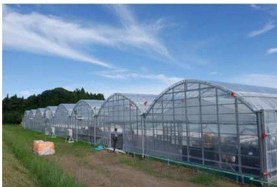
いちご低コスト耐候性ハウス（新城市）