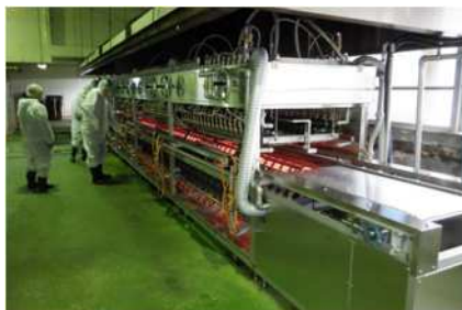
魚加工処理施設 魚焼き機 全景

養殖魚を加工する魚加工処理施設が40年以上経過して老朽化していることから、生産向上させるための、新たな魚焼き機の導入を支援しました。