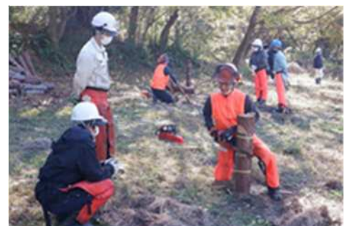
里山保全管理の実技体験（豊橋市）