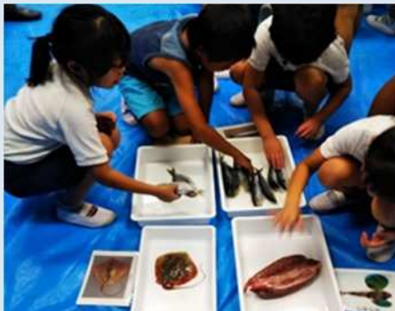
出前授業で水産生物に触れる子供達