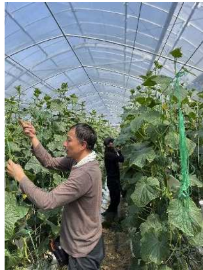
きゅうり栽培施設（西尾市）