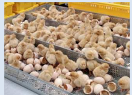
新種鶏場からのヒナ譲渡開始