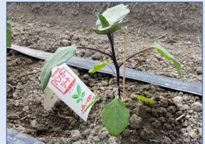
天敵を活用した IPM 技術