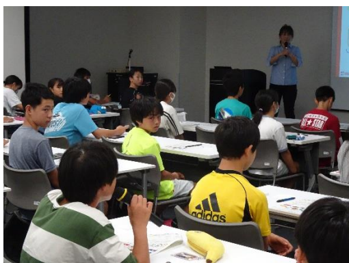
発表をするアカデミー生②