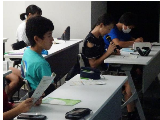
発表をするアカデミー生①