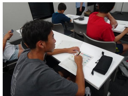
進んでメモをするアカデミー生