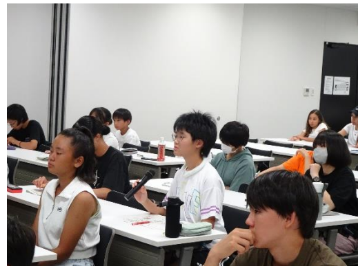
発表をするアカデミー生