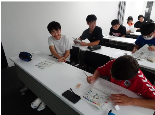
意見交換をする様子