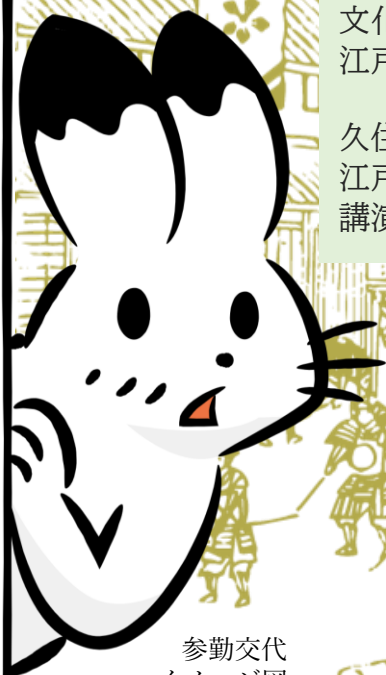
参勤交代 イメージ図

久住祐一郎氏の著書をはじめ、参勤交代や江戸藩邸、江戸時代の三河諸藩に関する図書を集めて展示します。講演と合わせて、ぜひご覧ください。