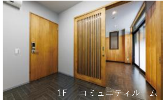
1F コミュニティルーム

構造／鉄骨造2階建 竣工／2023年2月 延面積／84.96㎡ 内装木質化面積／7.4㎡ 木材使用量／7.4㎡（腰壁）、0.0048㎡（標札） （すべてあいち認証材） 施主／愛知県警察本部 設計・監理／株式会社安藤建築設計 施工／ユニテック株式会社