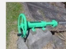
ゲート、バルブの更新