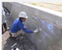
摩耗した水路壁への 表面被覆材の塗布