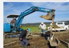
コンクリート水路の更新