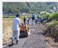
未舗装農道の舗装