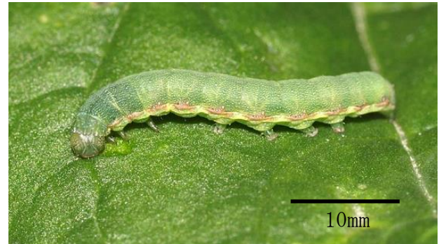
図 3 老齢幼虫