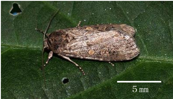
図 2 成虫

ふ化後しばらくは集団で生息し、齢が進むにつれて次第に分散する。成虫は 4 月から 11 月頃に、年 4～5 回発生する。非常に広食性で、キャベツのほか、ハクサイ、ダイコン、ネギ、ハウレンソウ、ダイズなど、50 種以上の野菜類や花き類におよぶ。