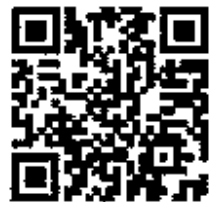
ホームページQRコード