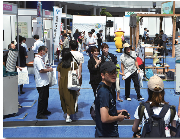
あいち住まいるフェア2022の様子