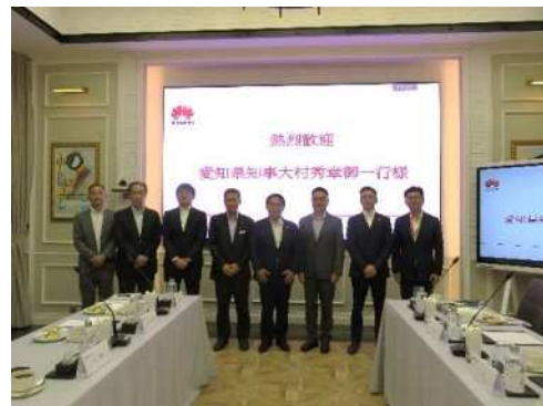
出席者の皆さんとの記念撮影 (右から3人目がボウ副総裁)