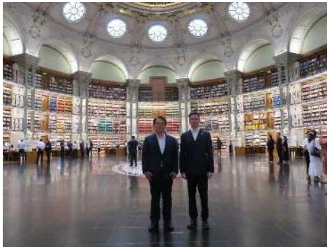
キャンパス内視察の様子⑤ (図書館にて)