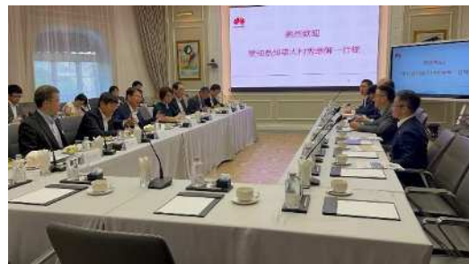
ボウ副総裁との面談の様子