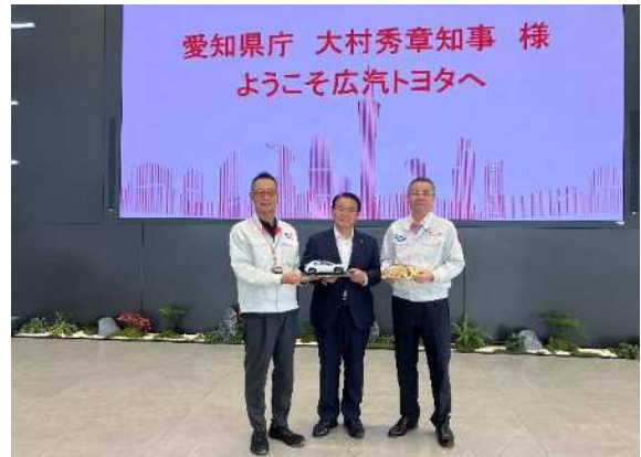
藤原総経理（左）と 文執行副総経理（右）との記念品交換