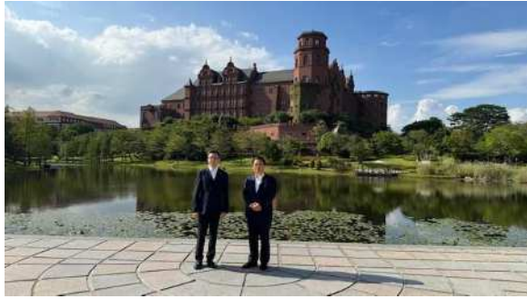
キャンパス内視察の様子③