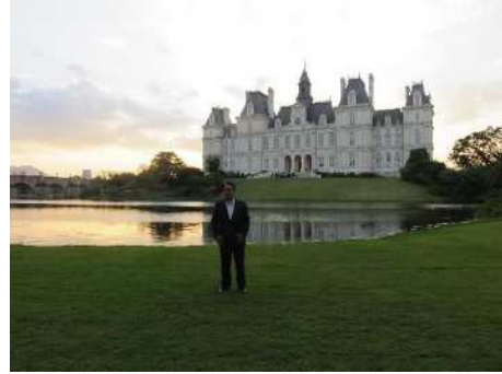
キャンパス内視察の様子④