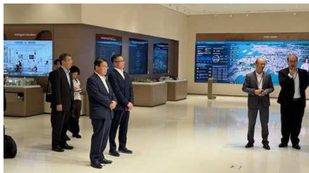
キャンパス内視察の様子① (デジタル展示ホールにて)