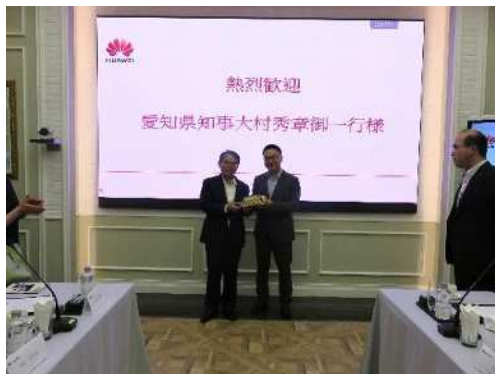
ボウ副総裁との記念品交換