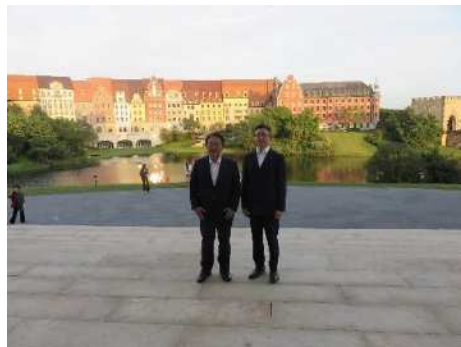
キャンパス内視察の様子②