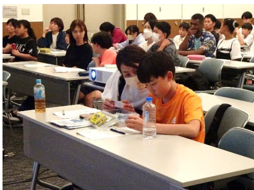
医薬品の成分を確認する様子