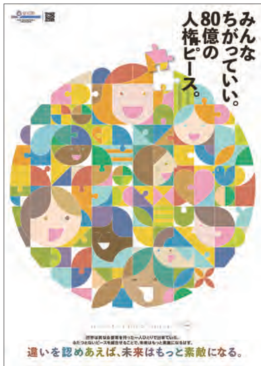
2024年度 人権啓発ポスター

人権に対する気づきや、理解を深めていただくきっかけとなるよう、ポスターや新聞広告掲載などにより啓発を行います。