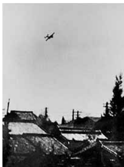
名古屋市初空襲のB25の写真