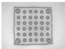
米から帰還した絹製ハンカチ