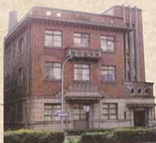
愛知県庁大津橋分室