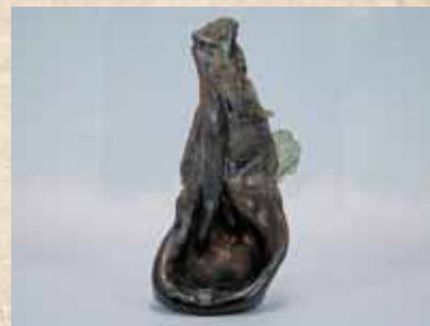
空襲で変形した瓶