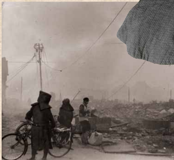
空襲後の様子(名古屋市内)