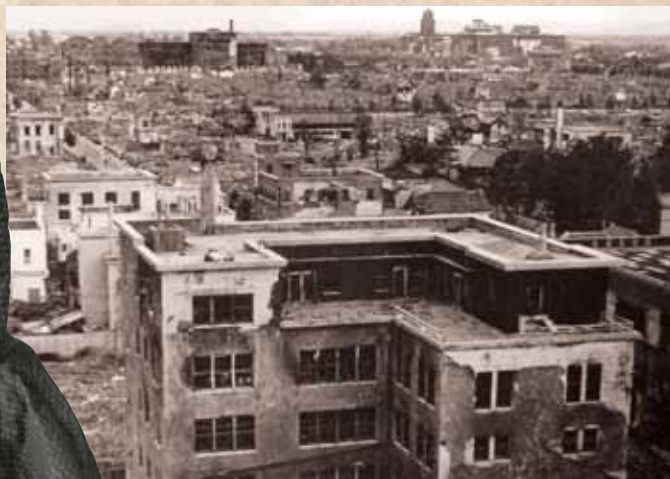
終戦後の様子(名古屋市内)