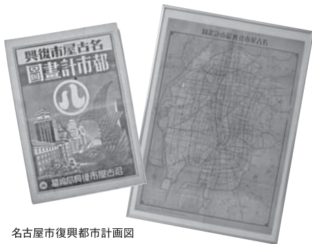
名古屋復興都市計画図