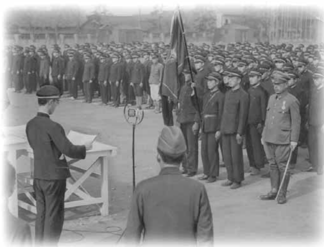
入営学徒壮行会