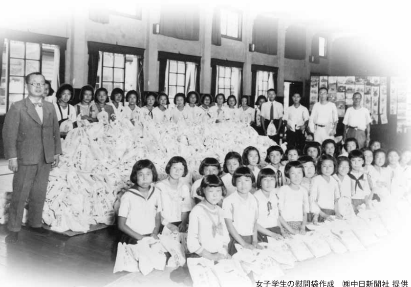
女子学生の慰問袋作成