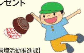
【環境部環境活動推進課】