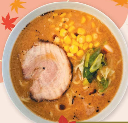
23日のみ しきぶスイーツキッチン みそしきぶラーメン