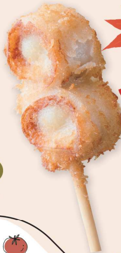
両日 ヤマサちくわ 竹輪うずらフライ