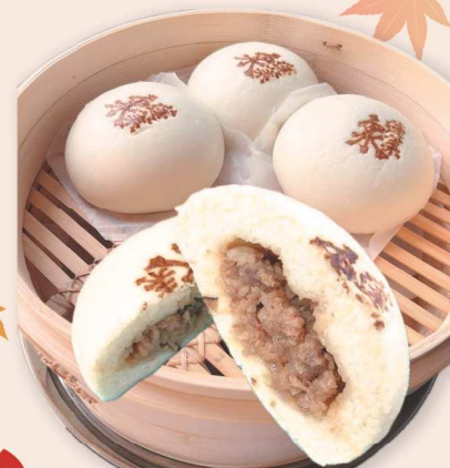
両日 関谷製菓 ほうらいせんキッチンカー 源氏和牛肉まん