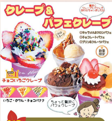
24日のみ Happy Holiday どうまいクレープ