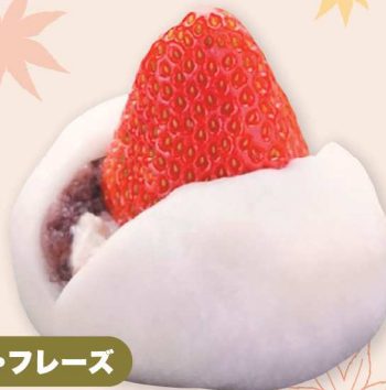
23日のみ レ・フリーズ いちご大福