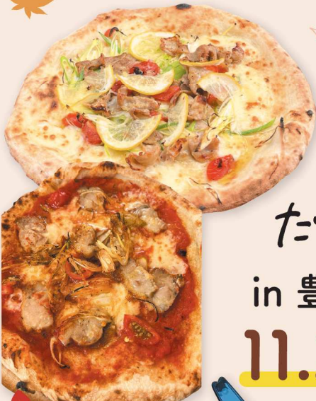
両日 Pizzeria Cielo 三河豚とレモンのPIZZA 三河鶏のディアボラPIZZA