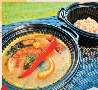
24日のみ スーパカレー あお空キッチン 2/3日分の野菜が食べられる スーパカレー