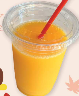
両日 メロンだメロン 蒲郡みかんジュース