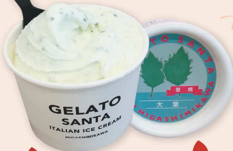
両日 ジェラートサンタ 大葉ジェラート