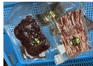
ジビエの森加工肉