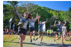
トレイルランニング