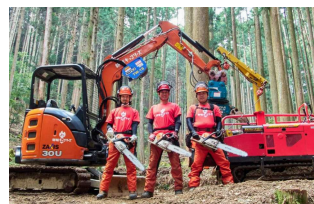
新城キッコリーズ

[2日目] モリトピア愛知・愛知県民の森(トレイルランニングを活用したチームビルディング、参加企業と地域事業者との意見交換、アンケートなど) == ○道の駅もっくる新城(自由昼食・買い物等) == 豊橋駅(14:30)