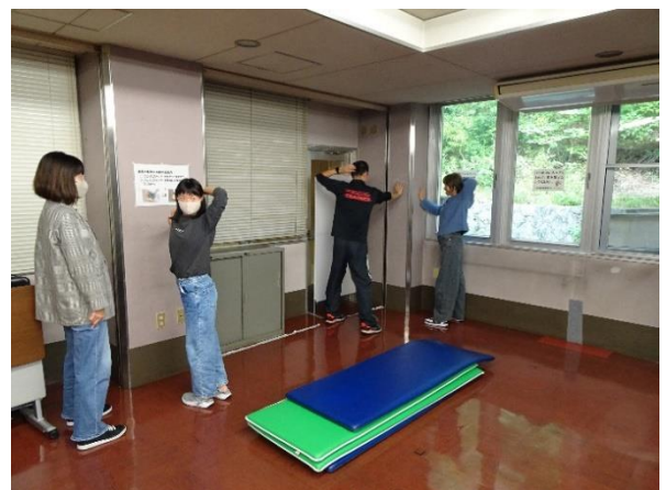
胸郭のストレッチ