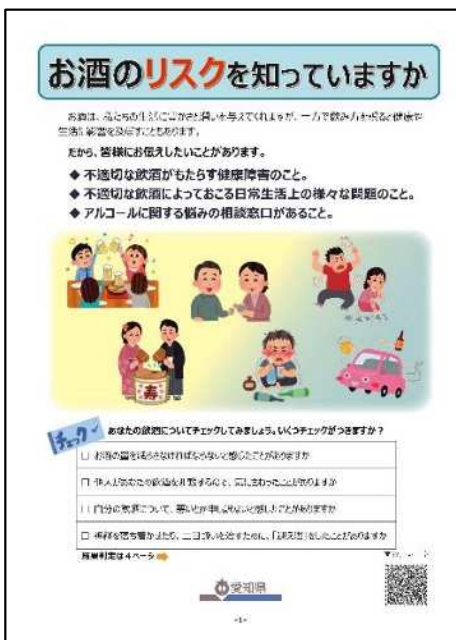
①県作成リーフレット