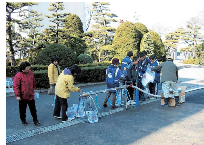
地震防災訓練の状況

県営水道はみなさんの生活や産業活動のライフラインとして重要な役割を果たしています。