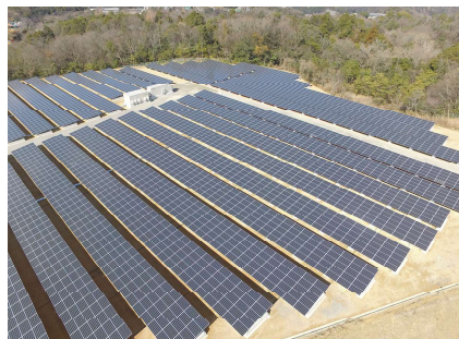
太陽光発電設備（犬山浄水場）