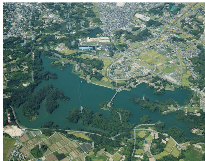
水源の森・佐布里池（2011年9月撮影）

県営水道では、ここをみなさんの生活にうるおいを与える、緑の安らぎの場として育てるとともに、きれいな水を送り続けるための水保全を行っています。