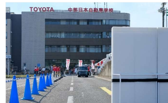
「スマートアシスト」