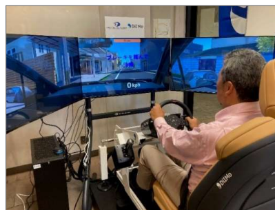
ドライビングシミュレータで運転する様子