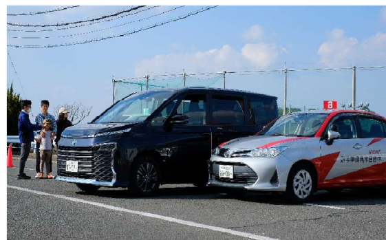
「アドバンストパーク」