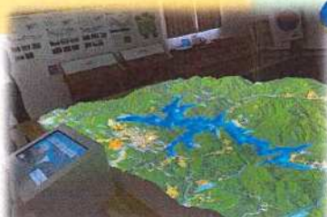
設楽ダム広報展示室3D模型