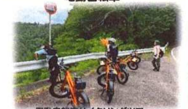
電動自転車サイクリングツアー