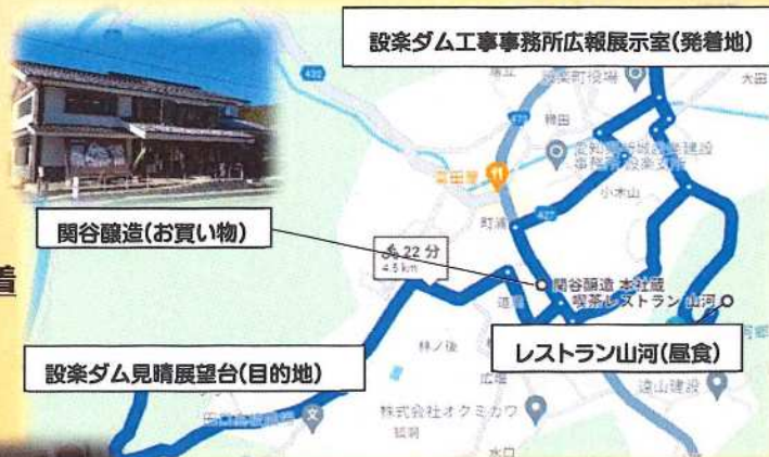
設楽ダム工事事務所 広報展示室(発着地)