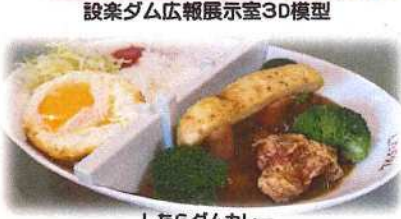
したらダムカレー