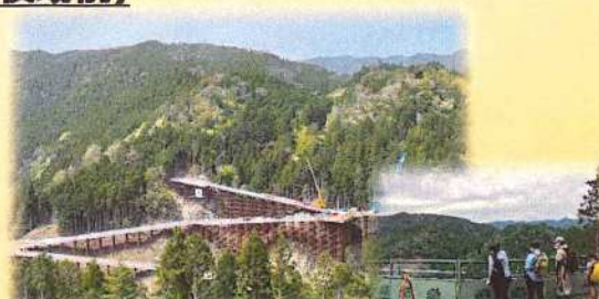
設楽ダム工事現場