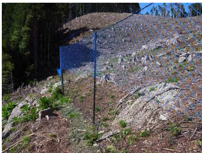
獣害防止柵設置状況