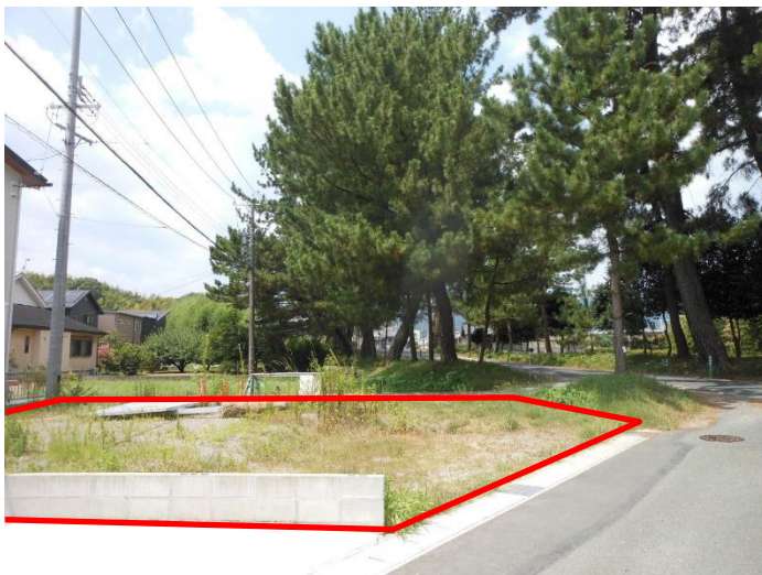
写真2 追加指定地（南東から） （赤線が追加指定範囲）