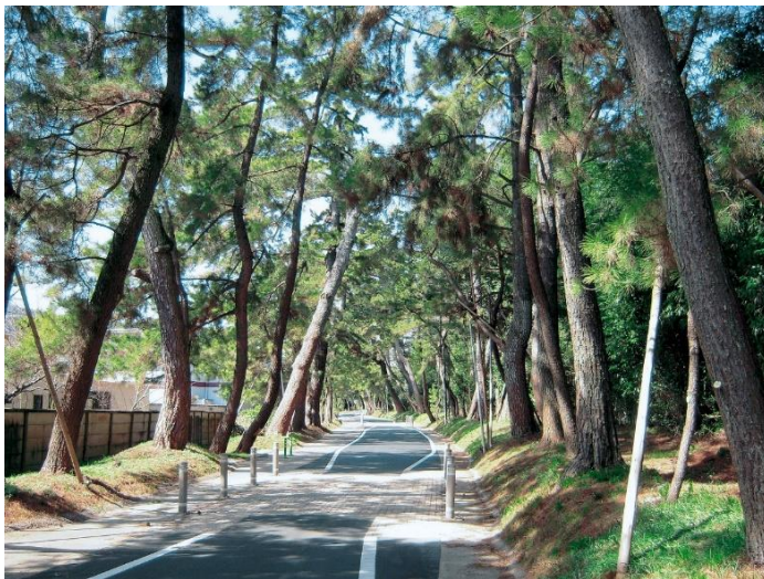
写真1 御油のマツ並木（南東から）

旧東海道に残されたクロマツの並木である。江戸時代からの古木も見られ、江戸時代後期の姿を今に残す代表的なものである。並木マツの根系を保護する目的で、道路敷の外側約15mを保存区域とし、順次追加指定を進めている。今回は同意の得られた民有地を追加指定するものである。