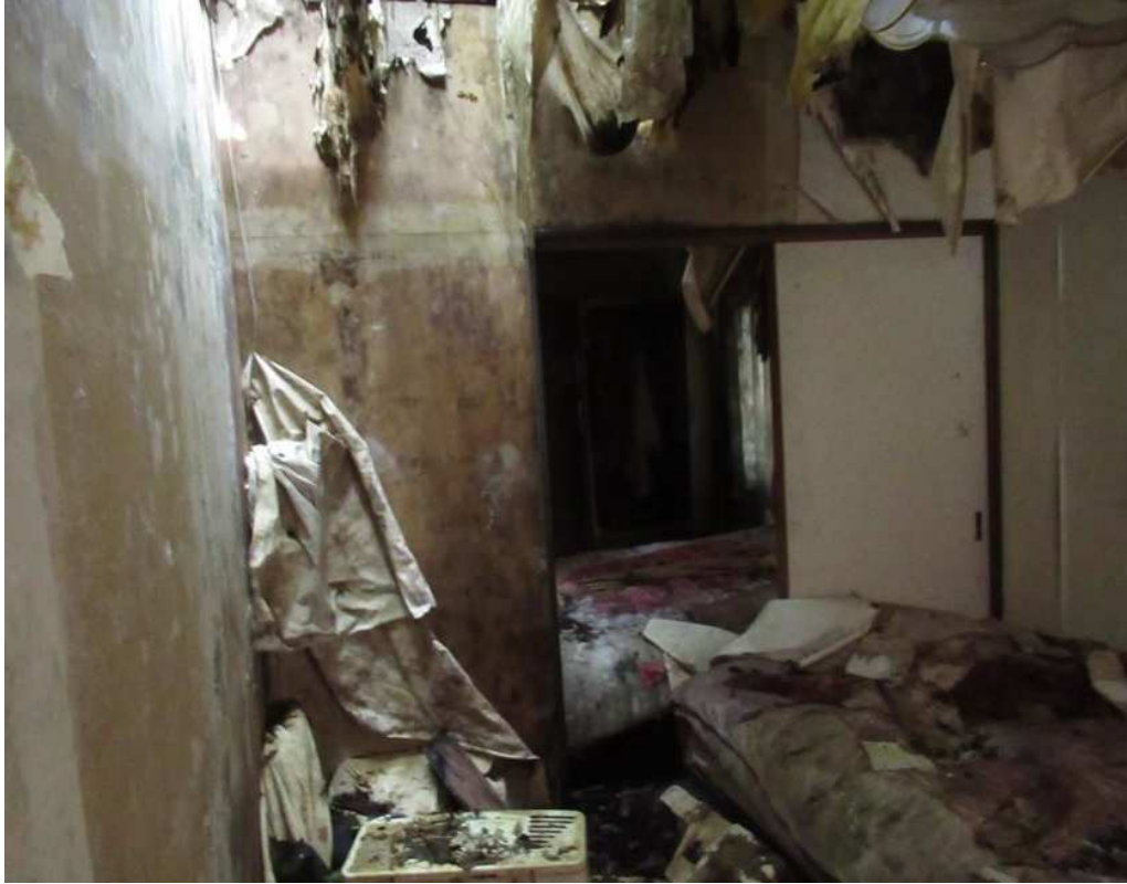
写真⑰ (内部 洋室 1)