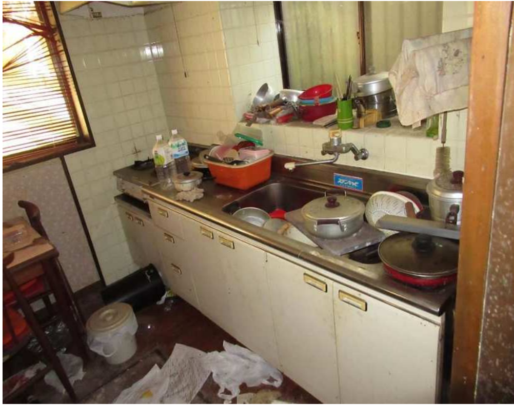
写真⑫ (内部 食堂・台所)