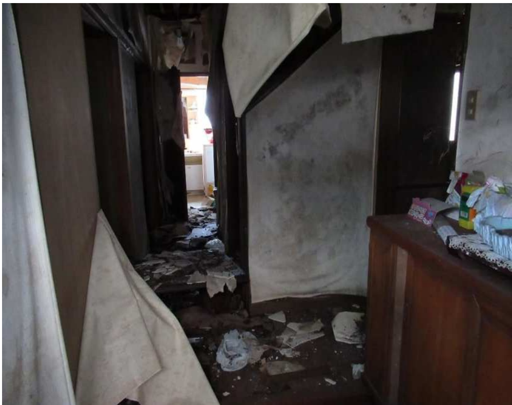
写真⑧ (内部 1階廊下)