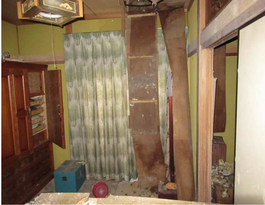
写真⑩（内部 和室 2）