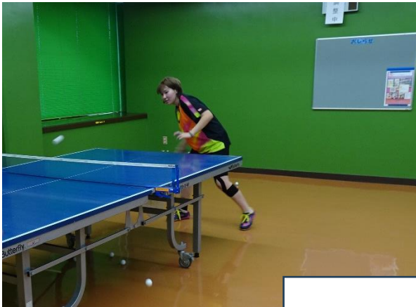
フォアハンド～バックハンド

ゲーム形式の練習では、ラケットが届くか届かないかきわどいボールを打つ際にステップをしっかり行い、動きの中でフォアハンドを強く打ち返すことや3、4球目の攻め方の確認を行っていました。試合で生かすことができる技術や戦術を習得しようとする緊張感のある練習ができていました。