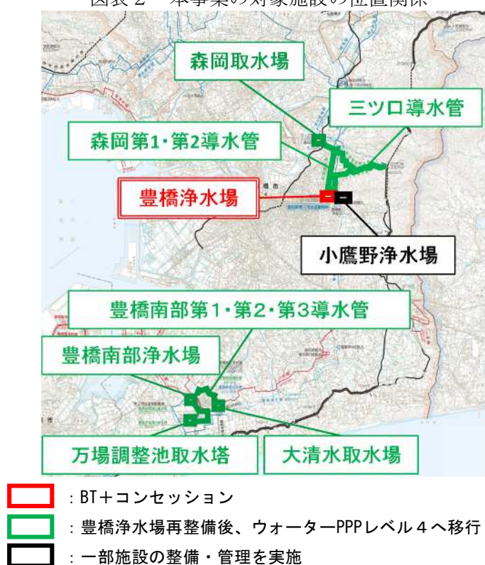
図表2 本事業の対象施設の位置関係

本事業の対象施設の位置関係は図表2のとおりです。現状の豊橋浄水場及び再整備後の浄水場施設に求める施設の概要は図表3、平面図は図表4のとおりです。豊橋南部浄水場の施設の概要は図表5のとおりです。