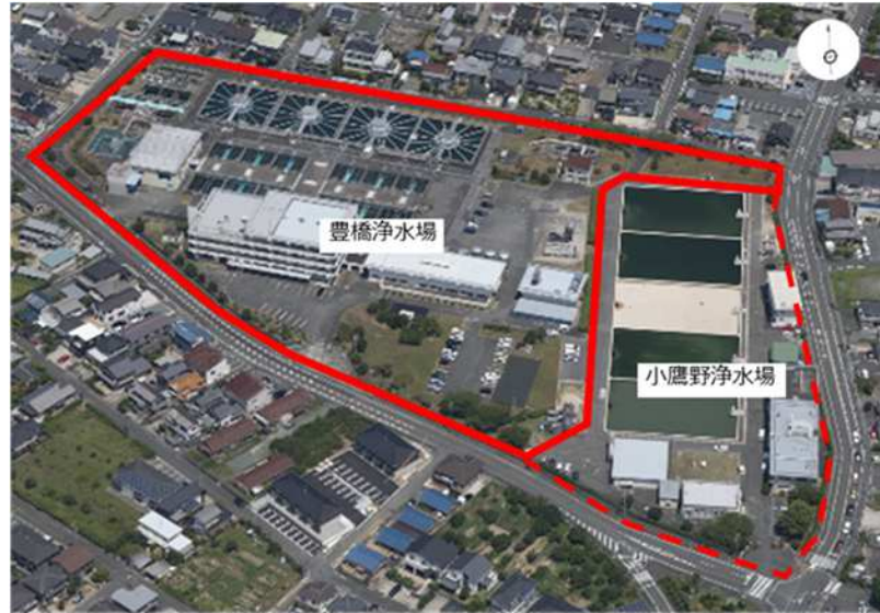
図表 1 豊橋浄水場全景