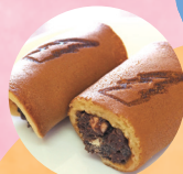
ブラックサンダー もちりあん巻き