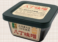
三河産大豆の八丁味噌