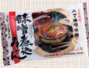
かきょう 角久八丁味噌 煮込みうどん