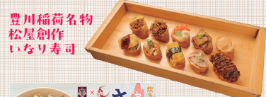
豊川稲荷名物 松屋創作 いなり寿司