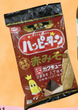
ハッピーターン あまから 赤みず味