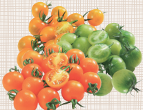
あまえぎみ イエロー・オレンジ・グリーン