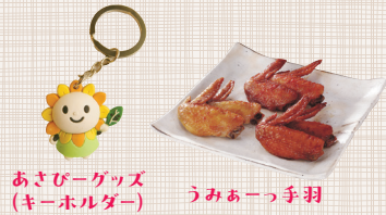
あさぴーグッズ (キーホルダー) うみあーっ手羽