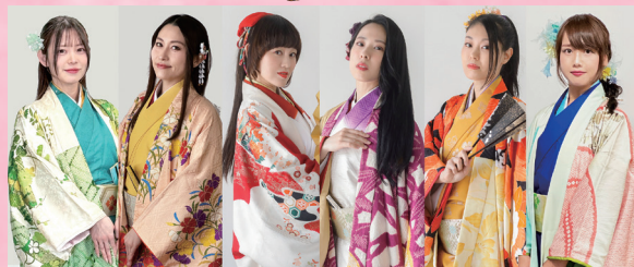
PRINCESS SAMURAI of JAPAN あいち戦国姫隊