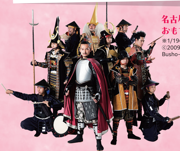
名古屋 おもてなし武将隊® ※1/19のみ ©2009 Nagoya Omotenashi Busho-Tai Secretariat